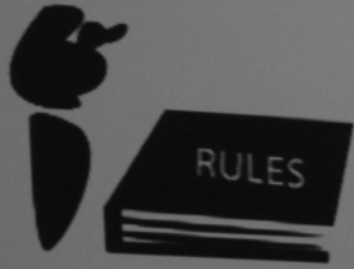
URBAN PLANNING DEPARTMENT